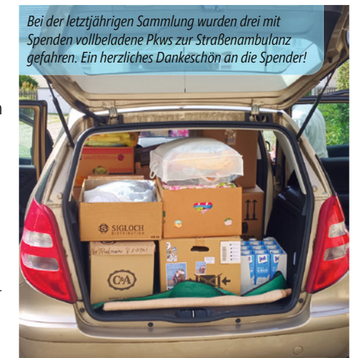
Bei der letztjährigen Sammlung wurden drei mit Spenden vollbeladene Pkws zur Straßenambulanz gefahren. Ein herzliches Dankeschön an die Spender!