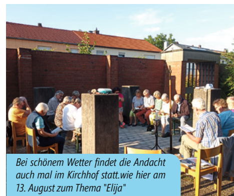
Bei schönem Wetter findet die Andacht auch mal im Kirchhof statt. wie hier am 13. August zum Thema „Elja“