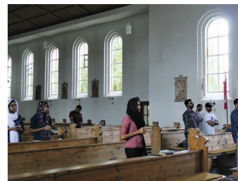
Die jungen Leute sind gerne zum Gottesdienst nach Altenfurt gekommen.

kömmlingen zu helfen, Fuß zu fassen, wichtige Kontakte zu knüpfen und in der Community eine Heimat zu finden. Die Anwesenden betonen, wie bedeutsam dies für sie ist. Sie sind in ihrer Kirche fest verwurzelt, zu Hause in Indien würden sie regelmäßig jeden Sonntag die Liturgie besuchen, erzählen sie. Wenn man ins Ausland gehe, würde man alles, was einem lieb und teuer sei, zurücklassen müssen, umso tröstlicher sei es, einmal im Monat mit Landsleuten Gottesdienst in der Muttersprache feiern zu können, bringt es ein Student auf den Punkt, der hofft, nach dem Examen hier einen guten Job zu finden. Ein anderer hat bereits Kontakte zu einem Sportartikelhersteller geknüpft; die Chancen, dass er dort arbeiten wird, sind groß. Wieder ein anderer hat den Sprung ins Arbeitsleben bereits geschafft – der Ingenieur hat eine Anstellung beim Fraunhofer Institut. Der Pfarrer kann die Bindung der Gläubigen an die Kirche bestätigen. Eine vergleichbare Austrittswelle – wie sie derzeit in der katholischen und evangelischen Kirche verzeichnet wird – gebe es in seiner Kirche nicht.