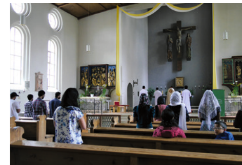
Im Gotteshaus nehmen Frauen und Männer getrennte Plätze ein