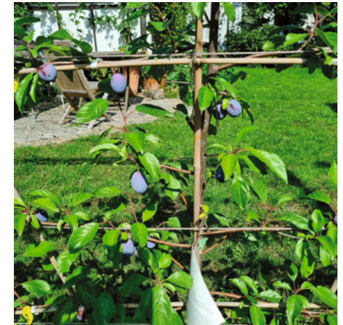
Heike Grander; Telefon: 836392